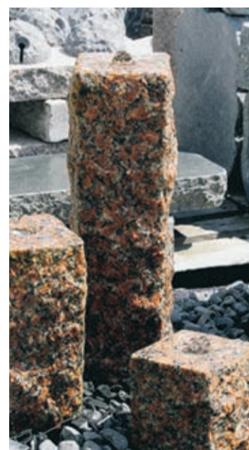
HETAST. Vattenstenar är det senaste för svenska trädgårdar.