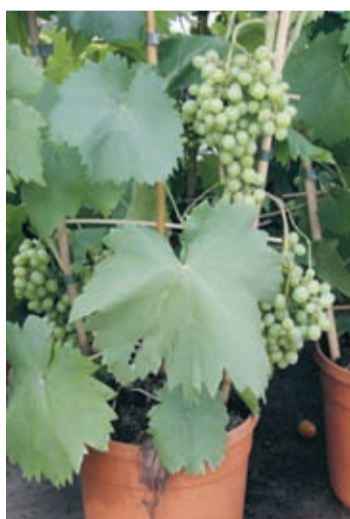
EXOTISKT. Numera odlas både vindruvor, aprikoser, kiwi och spansk peppar i våra trädgårdar. Men om de inte står i växthus måste de förstas få vara inne om vintern.