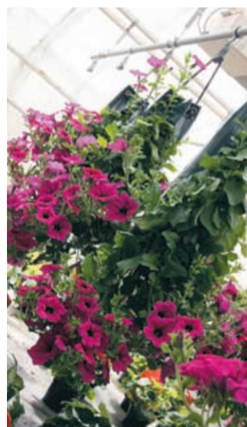
HÄNGANDE TRÄDGÅRDAR. Odlingssätten blir allt uppfinningsrikare.